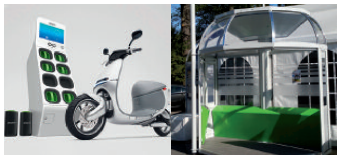
Scooter électrique en partage ou libre service